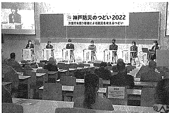
神戸市で開催された「次世代を担う若者による防災を考えるつどい」=16日